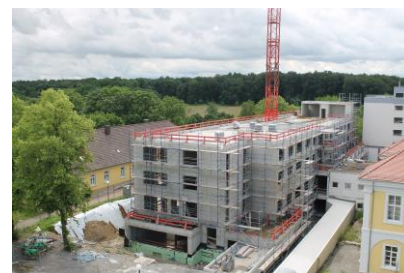
Fortschritte beim Neubau (Stand 17.06.16)

Vom 09.-10. Dezember 2016 findet eine Fortbildung „Konzeption und Durchführung von Stimmtrainings für Berufssprecher“ des Stimmheilzentrums statt. Weitere Informationen erhalten Sie unter sekretariatSTHZ@stimmheilzentrum.de .