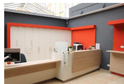
Neue Rezeption der Rosentrittklinik