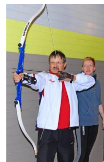
Bogenschießen als neues Therapieangebot