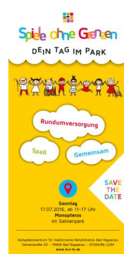
Save the date: Aktionstag Spiele ohne Grenzen am 17.07.2016 im Salinenpark Bad Rappenau